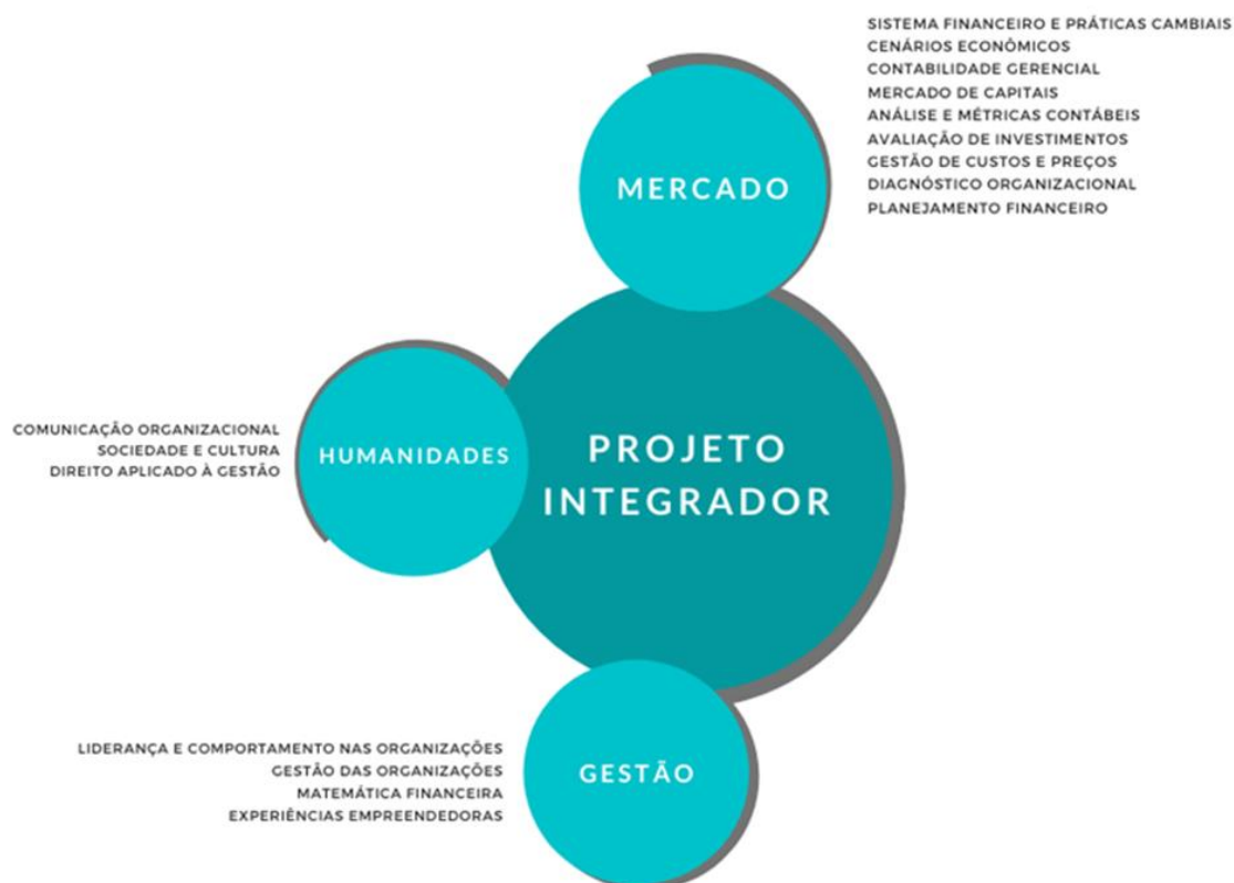
Figura 1: Representação gráfica do Curso Superior de Tecnologia em Gestão Financeira

No curso Superior de Tecnologia em Gestão Financeira, a organização curricular, conforme ilustra a figura 1, fundamenta-se nos princípios do Currículo Conectado da IES e contempla a flexibilidade necessária ao atendimento de todos os componentes curriculares no percurso de formação do futuro profissional. A figura 1 demonstra o movimento da formação proposta.