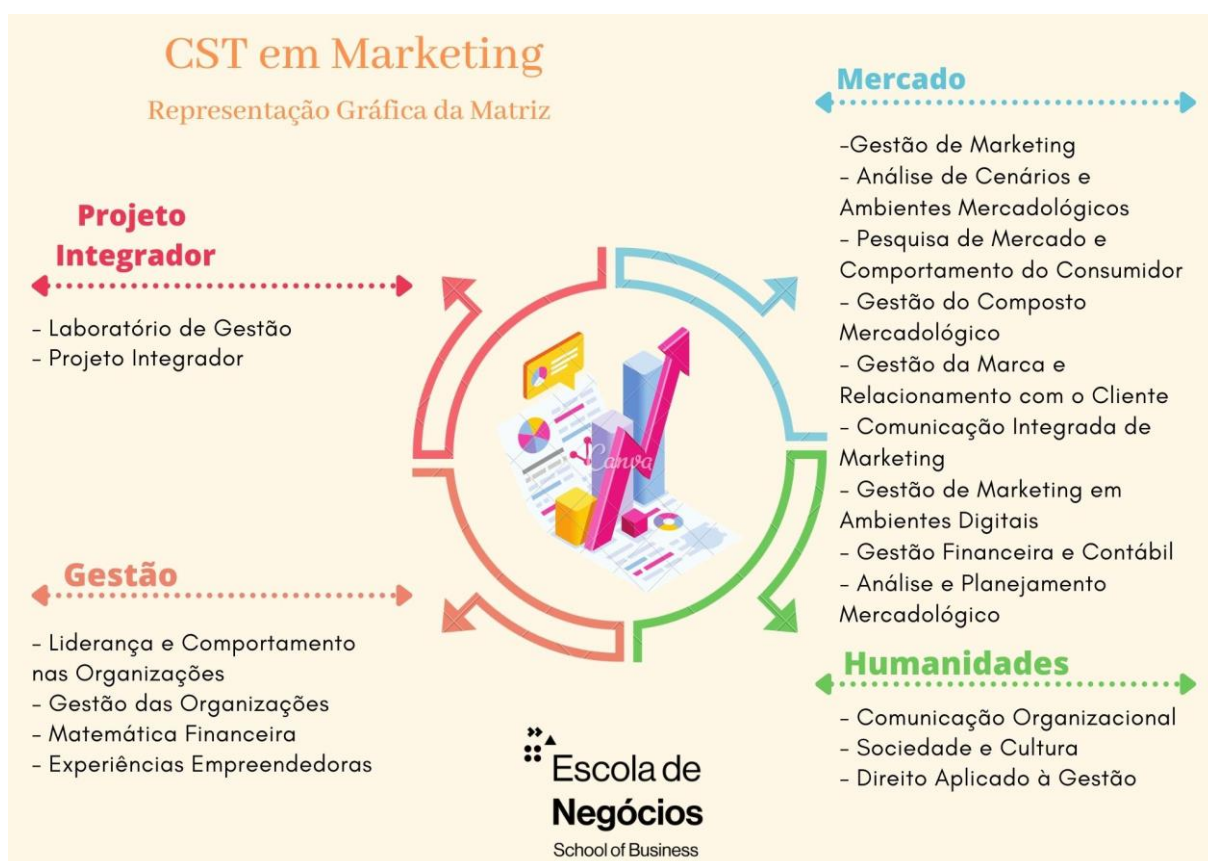
Figura 2: Representação gráfica do Curso de Tecnologia em Marketing EaD

No Curso Superior de Tecnologia em Marketing EaD, a organização curricular, conforme ilustra a figura abaixo, fundamenta-se nos princípios do Currículo Conectado da IES e contempla a flexibilidade necessária ao atendimento de todos os componentes curriculares no percurso de formação do futuro profissional. A figura 1 demonstra a o movimento da formação proposta.